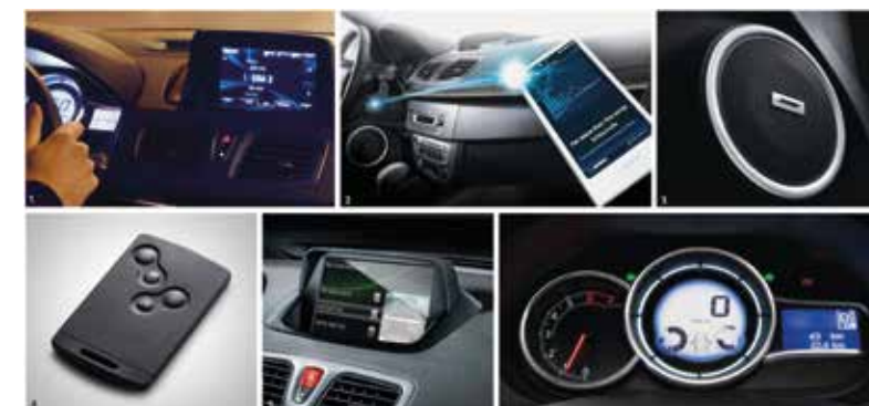
1. PANTALLA TACTIL DE 7" MULTIMEDIA • 2. BLUETOOTHS & HANDS FREE AUDIO STREAMING 3. SISTEMA DE AUDIO BOSE • 4. TARJETA MANOS LIBRES • 5. CAMARA DE VISION TRASERA